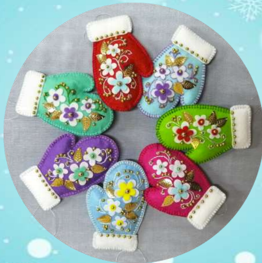
Подарочки родным и близким