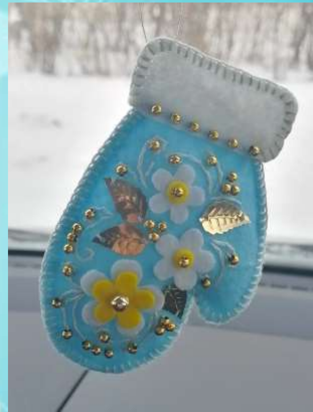
Подвеска в автомобиль